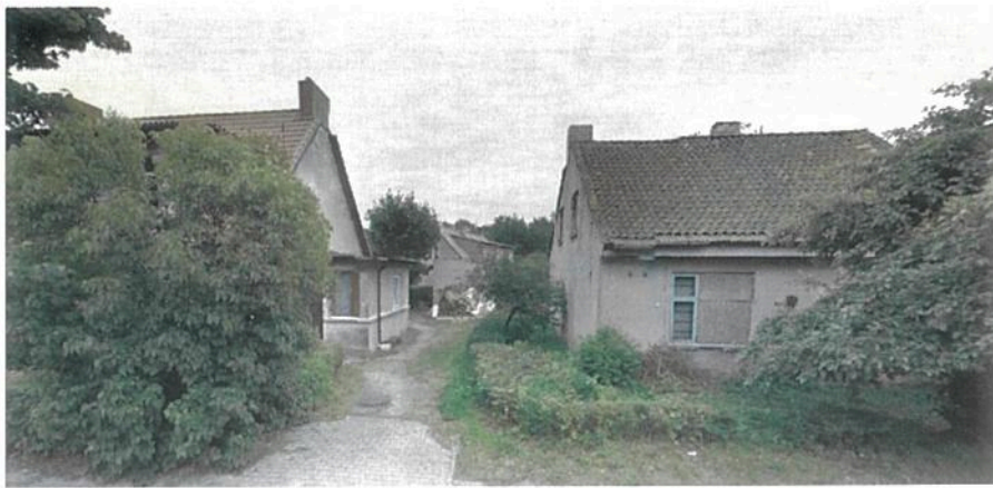
Molo g. 8 ir Molo g. 10