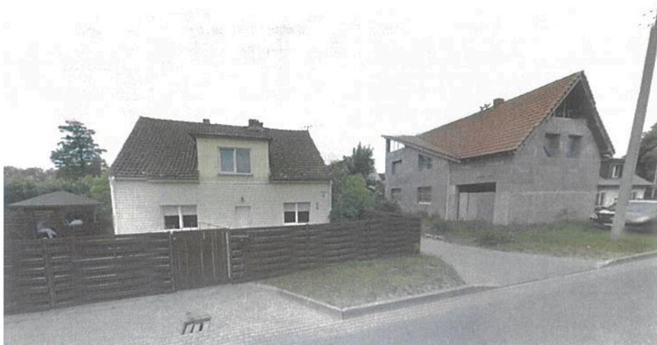
Molo g. 5

Tipiniai pavyzdžiai gyvenamui namui adresu Molo g. 7, esantys netoliese: