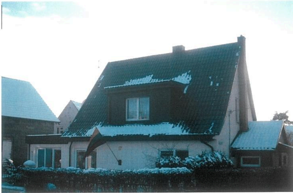
Molo g. 17