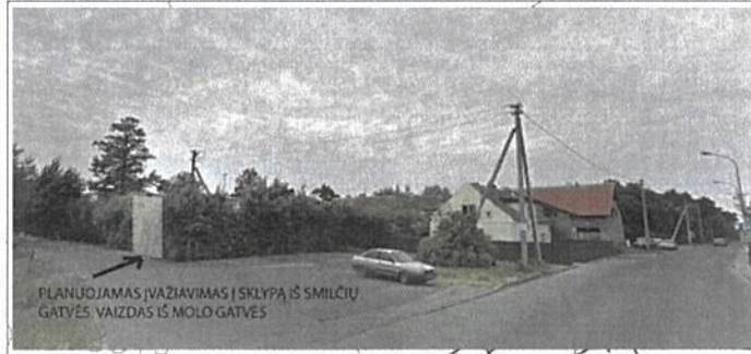
PLANUOJAMAS ĮVAŽIAVIMAS Į SKLYPĄ IŠ SMILČIŲ GATVĖS. VAIZDAS IŠ MOLO GATVĖS