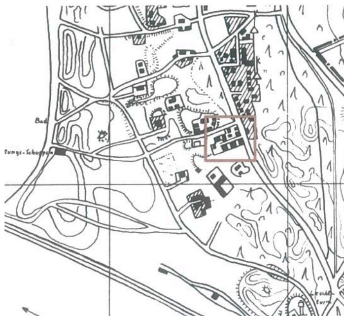
Ištrauka iš 1939 metų Mėmelio miesto plano. Apibrėžta nagrinėjama teritorija.