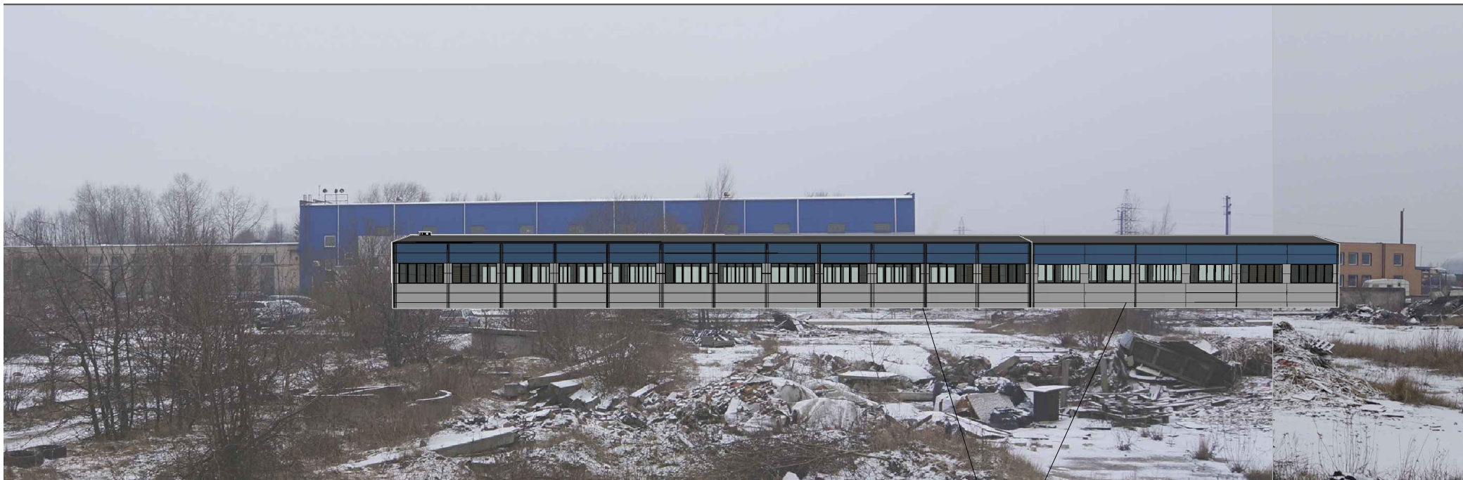
Projektuojamas sandėlio pastatas Liepų g. 87J Projektuojamas sandėlio pastatas Liepų g. 87K