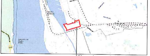
PLANUOJAMOS TERITORIJOS SITUACIJOS SCHEMA