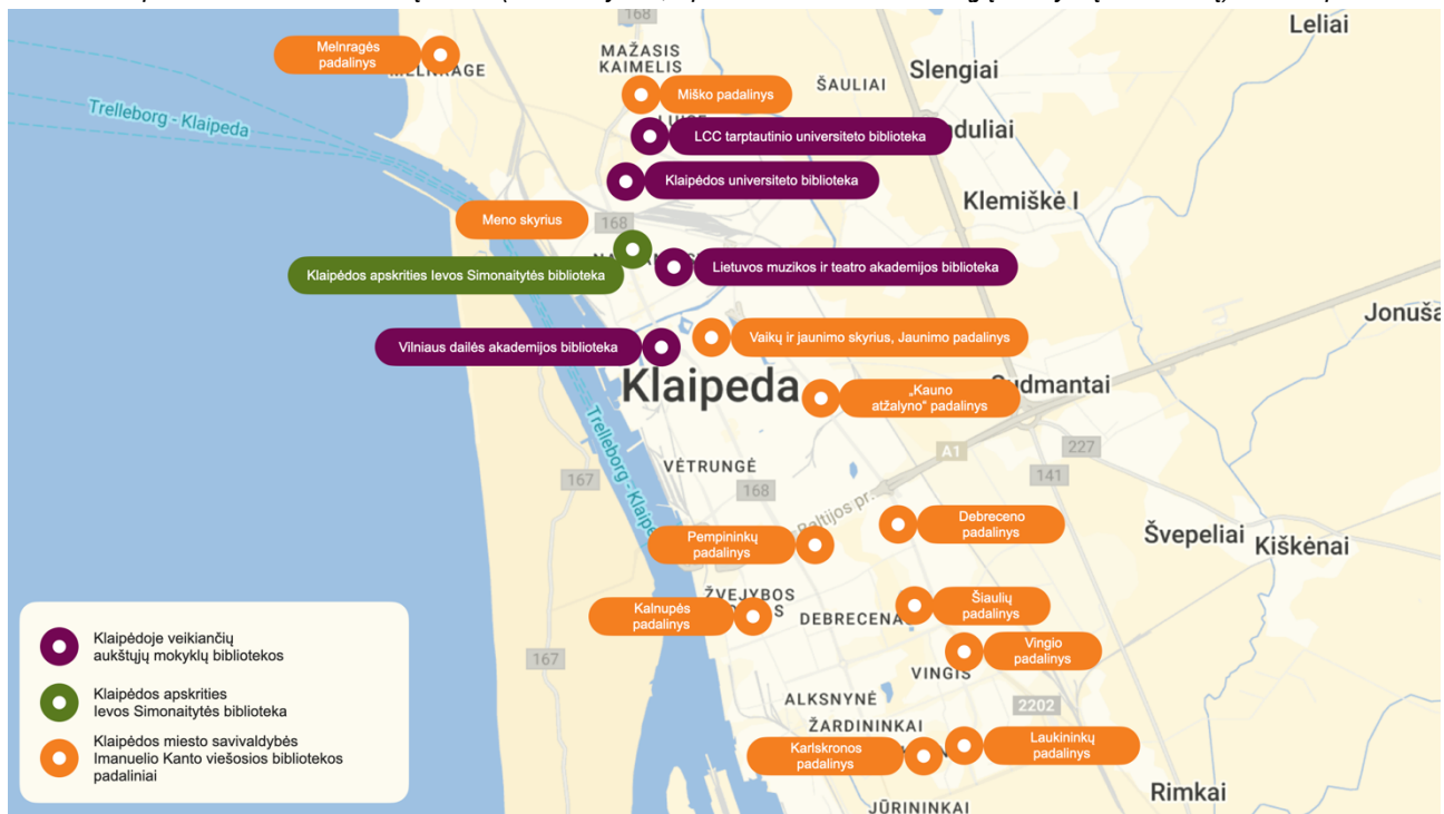
Pav. 1. Klaipėdos miesto bibliotekų tinklo (savivaldybės, apskrities ir dalies aukštųjų mokyklų bibliotekų) žemėlapis

Klaipėdos miesto bibliotekų tinklas yra pasiskirstęs po skirtingus miesto rajonus. Didžioji dalis bibliotekų priklauso Klaipėdos miesto savivaldybės Imanuelio Kanto viešajai bibliotekai. Miesto bibliotekų tinklas pavaizduotas žemėlapyje.