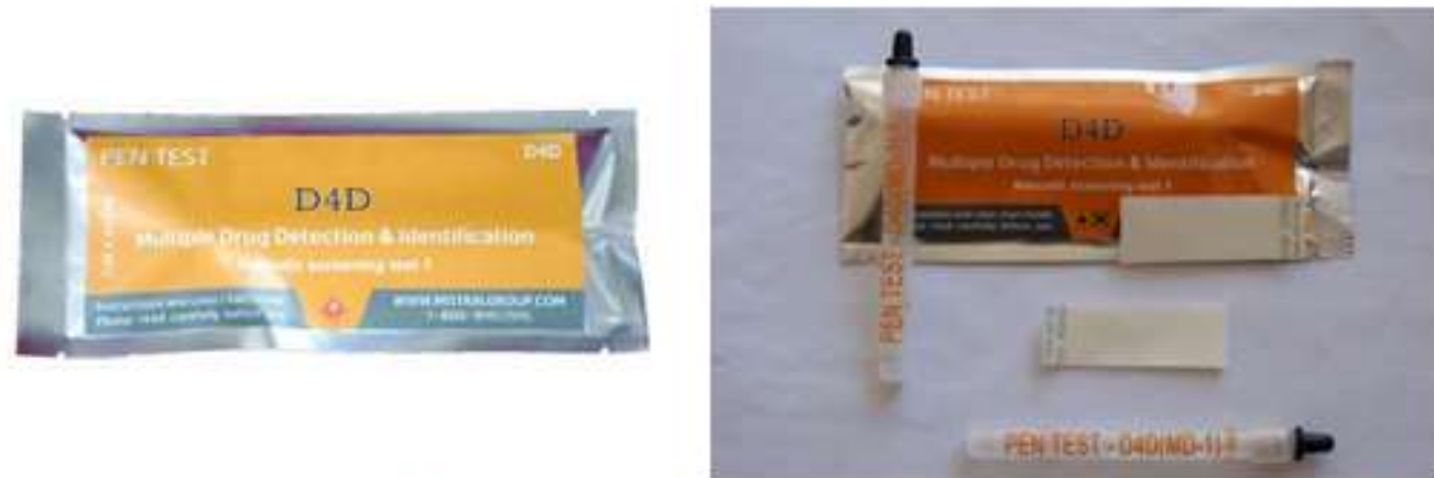
1 pav. Narkotikų testai, kurie buvo naudoti ugdymo įstaigų aplinkos ištyrimui dėl narkotinių medžiagų paplitimo

Testavimas ugdymo įstaigoje atliktas naudojant universalius narkotikų testus, skirtus paplitusioms narkotinėms ir psichotropinėms medžiagoms aptikti ir identifikuoti – D4D PENTEST (2 juostelės). Testai skirti aptikti šias narkotines medžiagas: Kanapes, Amfetaminą, PCP, Heroiną ir Opiumą, LSD, Buprenorfiną, Ekstazį, ketaminą ir Metadoną.